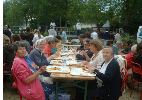
Fête de quartier Nouvelle Ville 2008, avec sur scène les chanteurs d'un groupe hip-hop du FJT Courbet.

Issu de mouvements sociaux, à la fin du XIX ème siècle, le Centre social se développe surtout au milieu du XX ème , pour devenir soit Maison de quartier, soit Maison pour tous ou encore Centre socioculturel. On en compte 2000 aujourd'hui.