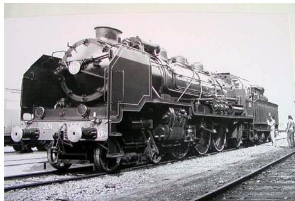
« Pacific » 231 G 558 et son tender 22 C 367